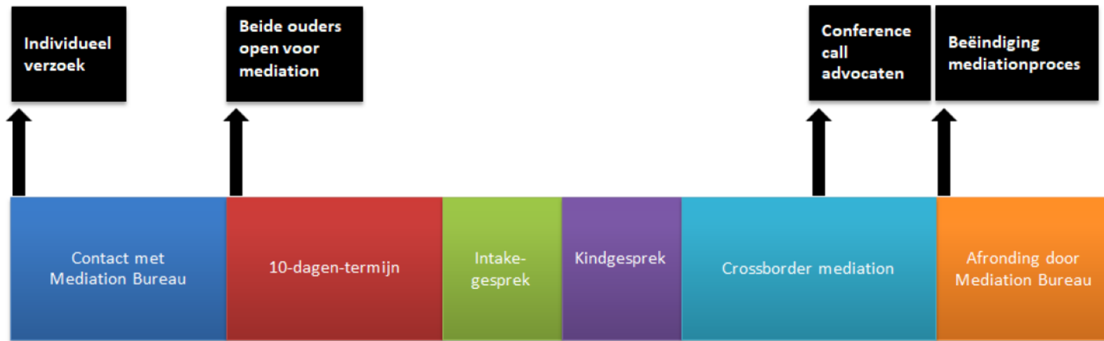
Figuur 1: Mediationproces in beeld